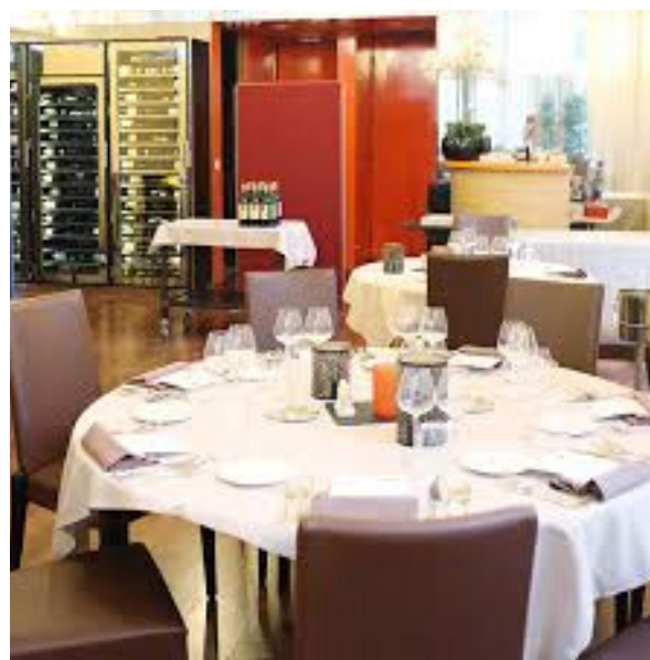
Lycée Guillaume Tirel